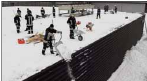
PASSAU: Rund 60 Männer von Feuerwehr und THW schaufeln als Vorichtsmaßnahme das Dach der Eis-Arena frei.