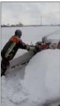
JANDELSBRUNN: Ein Feuerwehrmann schaufelt den Schnee vom Dach der Firma Knaus-Tabbert.