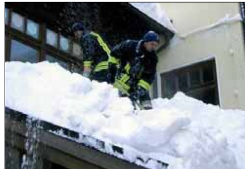
Auch das Dach der Lindberger Grundschule wurde von der schweren Last befreit. Schul- und Kindergartenkinder wurden evakuiert und trafen sich zur gemeinsamen Pause im Feuerwehrhaus.

In der alten Mädchenschule wurde angeordnet, dass sich die beim Umbau beschäftigten Arbeiter bis auf Weiteres nur im Erdgeschoss aufhalten dürfen. Das Waldmuseum wurde gestern dicht gemacht. „Auch das Rathaus müsste eigentlich geschlossen werden“, sagte Ernst Kamm, „aber man kann nicht die Leute als erstes heimschicken, deren Aufgabe es ist, für Sicherheit und Ordnung zu sorgen“. Sobald die Hauptschule frei ist, geht der Schaufeleinsatz am Rathaus, am Haus des Gastes und am Museum weiter. Dazu wurden die Holzbaufirmen Schiller und Dengler beauftragt, die zur Sicherung mit ihren Kränen anrücken. Weiter geht es dann mit dem städtischen Wohngebäuden, mit dem Leichenhaus und dem Infozentrum. Die Stadtwerke kümmern sich um Hallenbad und Sauna.