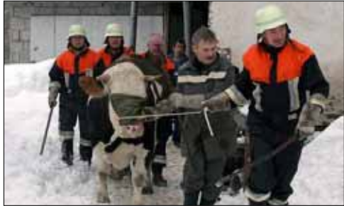
DEGGENDORF: Die Rinder können aus einem eingestürzten Stall in Leutersberg gerettet werden.