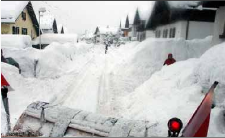
ZWIESEL hat derzeit mit am meisten Schnee im Bayerischen Wald. Am Straßenrand türmen sich die Schneemassen teilweise bis zu 2,50 Meter hoch.