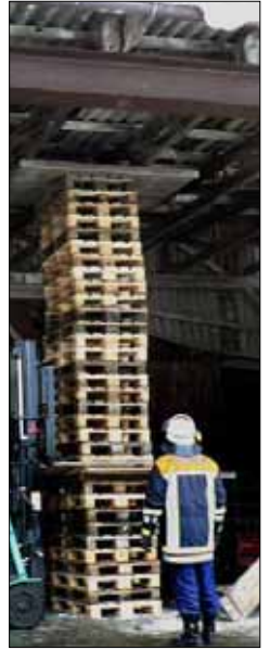
SCHÖNBERG: Paletten stützen das Lagerhallendach der Schlosskellerei Ramelsberg.

In Oberbayern sind mehrere Straßen wegen Lawinengefahr gesperrt. Auch heute soll es vom Allgäu bis zum Bayerwald weiterhin heftig schneien.