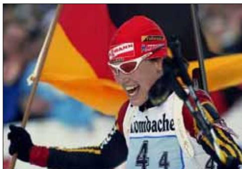
Biathlon-Doppel-Olympiasiegerin Kati Wilhelm, hier beim Biathlon-Weltcup 2004, wird morgen bei der Eröffnung der Olympischen Winterspiele in Turin die deutsche Fahne tragen.

Turin (dpa). Die Anfrage erreichte sie noch vor dem Frühstück und Kati Wilhelm zögerte mit ihrem Ja keine Sekunde: Die Biathlon-Doppel-Olympiasiegerin von 2002 in Salt Lake City wird morgen bei der Eröffnungsfeier der XX. Olympischen Winterspiele in Turin die deutsche Fahne tragen. „Auch wenn ich nicht die erste Wahl war und vor mir einige abgelehnt haben, empfinde ich es als Ehre, dass ich die Fahne tragen darf. So etwas erlebt man in seinem Leben ja nur einmal“, sagte die Gesamtweltcup-Führende aus Zella-Mehlis, die im österreichischen Trainingsquartier in Oberillach von ihrem Glück erfuhr. Zuvor hatten Wilhelms Teamkollegin Uschi Disl, Rodel-As Georg Hackl und die Eisschnellläuferinnen Anni Friesinger und Claudia Pechstein abgesagt.