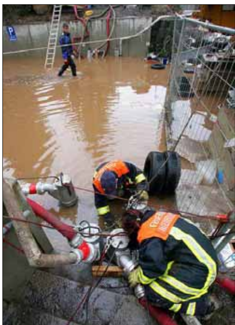
DRESDEN: Feuerwehrlente pumpen eine Tiefgarageneinfahrt frei. Tauwetter führte in Sachsen vielerorts zu Überschwemmungen.