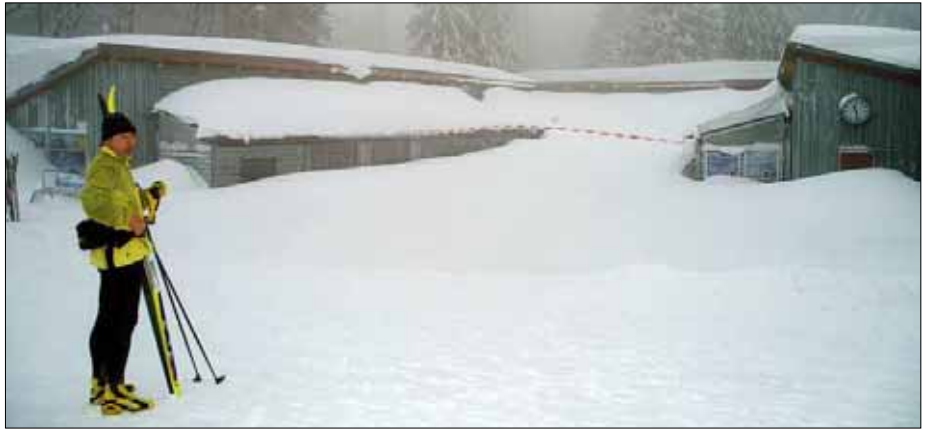
Das Funktionsgebäude im Langlaufzentrum Bretterschachten versinkt im Schnee. Der gläserne Gang am Gebäude ist zum Schneetunnel geworden.

In der Gemeinde Rinchnach ist es gestern am frühen Morgen finster geworden - Stromausfall. EON-Sprecher Michael Schaller, Regensburg: „In Rinchnach war von 5.24 bis 5.50 Uhr der Strom weg, die 20-kV-Leitung Regen-Rinchnach-Kirchberg hat sich abgeschaltet. Wir haben dann einfach wieder eingeschaltet und es ging wieder, es war also kein Abriss.“ Gestern sind die EON-Leute die Leitungstrasse abgegangen. Die Gemeinde ließ vorsichtshalber die Schulturnhalle abschaufeln. In Bodenmais hat es gestern