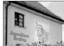
Braucht eine größere Renovierung: das KJR-Jugendhaus in Krailing.

Am 16. Februar fährt der KJR gemeinsam mit der KEB auf