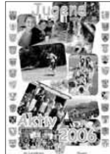
„Jugend aktiv“: Die Neuauflage 2006 der Broschüre zeigt die Bandbreite der KJR-Aktivitäten.