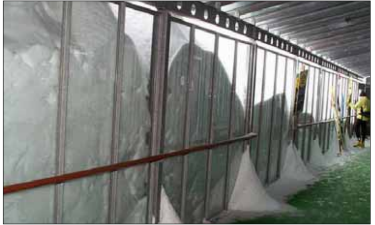
BODENMAIS: In einem Schneeberg ist das Funktionsgebäude des Langlaufzentrums Bretterschachten fast vollständig versunken. An einem Tag fiel hier ein Meter Neuschnee.