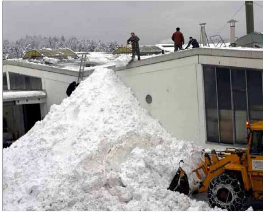
Das Dach der Firma Heyco in Tittling (Lkr. Passau) musste gestern – wie viele andere auch – von den Schneemassen befreit werden. Neben freiwilligen Helfern und Feuerwehrleuten waren auch Soldaten in den betroffenen Landkreisen im Schnee-Einsatz.

Schneemassen bedrohen Gebäude in Passau, Deggendorf, Freyung-Grafenau und Regen – Bundeswehr im Einsatz