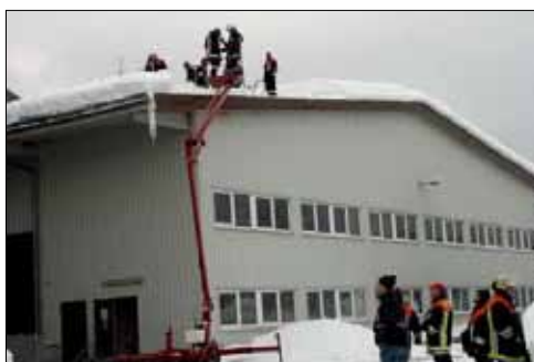
Großeinsatz hatten gestern die fünf Feuerwehren der Stadtgemeinde auf dem Dach der Firma SBR in Fürhaupten.

In Frauenau wurde aus Sicherheitsgründen die Bürgerhalle gesperrt und in Bayer. Eisenstein die Waldler-Hütt'n. Wie Eisensteins Bürgermeister Thomas Müller gestern Abend noch mitteilte, wurden die Feuerwehren der Grenzgemeinde zu einem Schaufeleinsatz zum Tiermuseum Pfeifer in Regenhütte gerufen. Gegen 18.30 Uhr schickte man aus Sicherheitsgründen die Besucher des Wellenbades nach Hause.