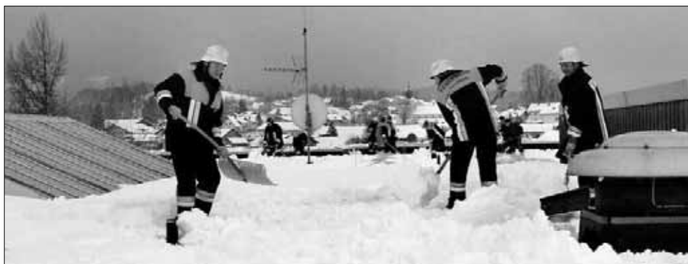
Gestern Nachmittag in Ruhmannsfelden: Feuerwehrleute räumen die tonnenschwere Schneelast auf den Schuldächern.