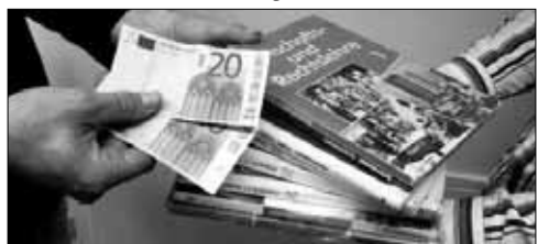
39 Gemeinden waren bisher dem Beispiel der Stadt Passau gefolgt und übernahmen das Büchergeld – das ist nun unzulässig.

Nach der neuen Rechtslage sind alle Kommunen verpflichtet, das Büchergeld einsammeln zu lassen. Bürgermeister, die sich nicht dran halten, erfüllen womöglich den Tatbestand der Untreue. Von sich aus will das Innenministerium die Bürgermeister aber offenbar nicht verfolgen. 39 Gemeinden in Bayern folgten bisher dem Beispiel der Stadt Passau und zahlten das Büchergeld aus der Stadtkasse. Mehrfach wurde versichert, dass die Großzügigkeit zulässig, das Einsammeln des Geldes nicht zwingend erforderlich sei. Auch vom Innenminister gab es entsprechende Aussagen. Auf Proteste der kommunalen Spitzenverbände hin wurde aber nun die Rechtslage erneut geprüft.