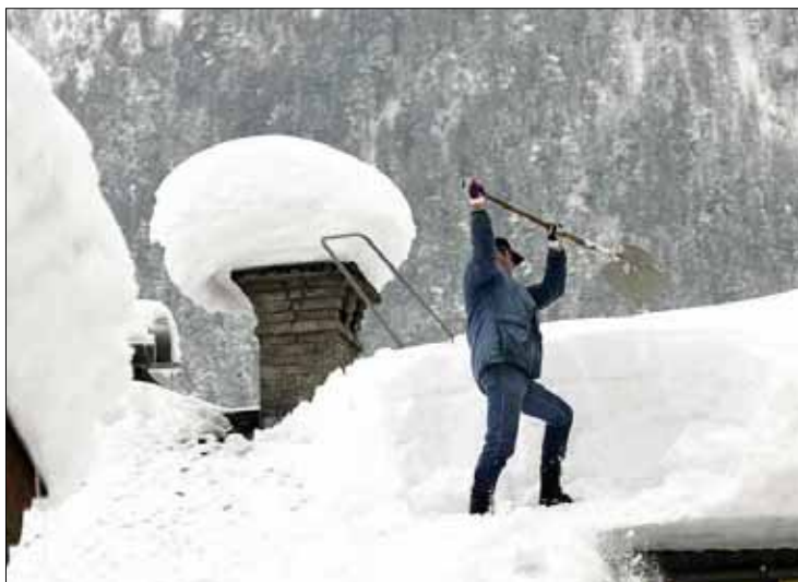
SALZBURG: Meterhoch türmt sich derzeit der Schnee auch auf Gebäuden in Österreich. Hier kämpft ein Hausbesitzer in Lofer im Bundesland Salzburg gegen die schweren Schneemassen auf seinem Dach.