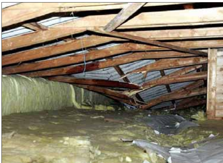
SCHÄRDING: Die Last des Schnees hat gestern die Dachbalken der Volksschule Kopfing eingeknickt. Verletzt wurde dabei niemand. 85 Schüler und sieben Lehrer hatten das Gebäude kurz vorher verlassen.