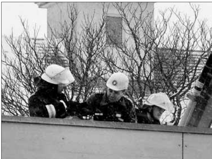
Sachverständige inspizierten gestern im Beisein der Feuerwehr die Supermarkt-Halle.