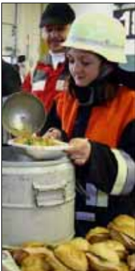
PASSAU: Das Bayerische Rote Kreuz versorgt die Feuerwehrmänner im Schnee-Einsatz mit Eintopf und Wurstsemmeln.