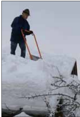
Luftige Schneeschaufelei, überall werden die Dächer vom Schnee befreit.

Regen (bb). Schneefrei gibt es heute an einigen Schulen und Kindergärten im Landkreis. Neben der Grund- und Hauptschule Regen, der Hauptschule Zwiesel und der Grundschule Lindberg bleiben heute, Donnerstag, auch die drei Regener Kindergärten St. Josef, St. Michael und St. Anna geschlossen. In den Schulen laufen Schneeräum-Aktionen, in den Kindergärten sind die Fluchtwege vom Schnee versperrt, so die Begründung für den freien Tag.