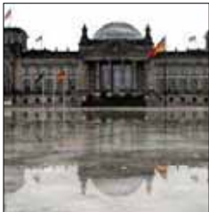
BERLIN: Der Platz vor dem Reichstag war gestern überflutet.

In Schleswig-Holstein überflutete Wasser von umliegenden Feldern die Autobahn A 24 von Berlin nach Hamburg, weil es bei Talkau auf dem gefrorenen Boden nicht versickern konnte. Die Feuerwehr pumpte mehrere Stunden